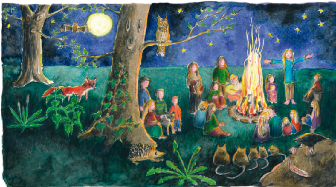
C Mechtild Frintrup